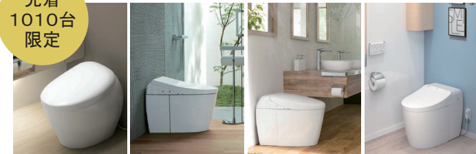
NX AH RH DH

先着 1,010 台でネオレストご採用1物件につき、ギフトを1つプレゼント(申込制)「家でのご飯が楽しくなる」ギフトをご用意!