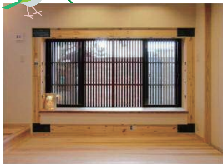
耐震開口フレームと高性能サッシ