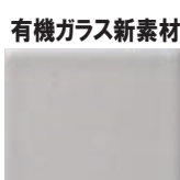
汚れがつきにくく、しかも丈夫です。