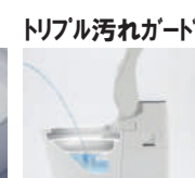
泡のクッションや便器・便座の形状で、おしっこ汚れを抑制します。