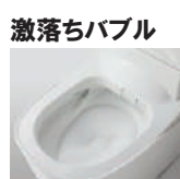
ミリバブル、マイクロバブルの2種類の泡でしっかり汚れを落とします。