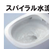
少ない水量で高い洗浄力を発揮します。