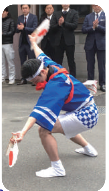
初出の朝一番には、 パナソニックエコソリューションズ社様、 KMEW 様と毎年恒例の初荷式を行いました！