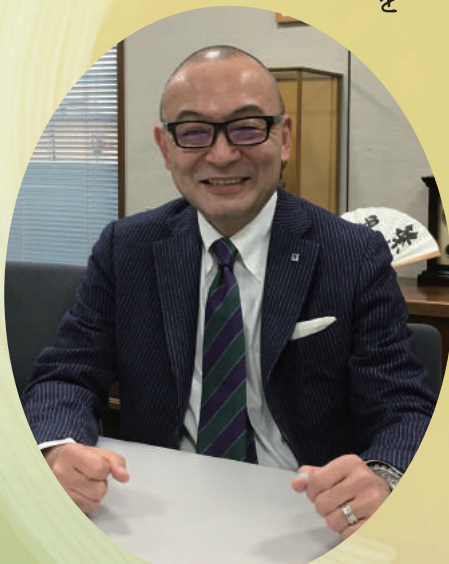
平安建材株式会社 代表取締役社長