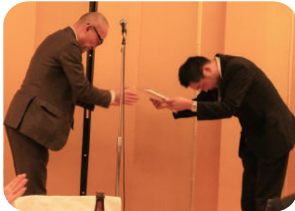
ありがとうございました！ 今年もご協力お願いします！