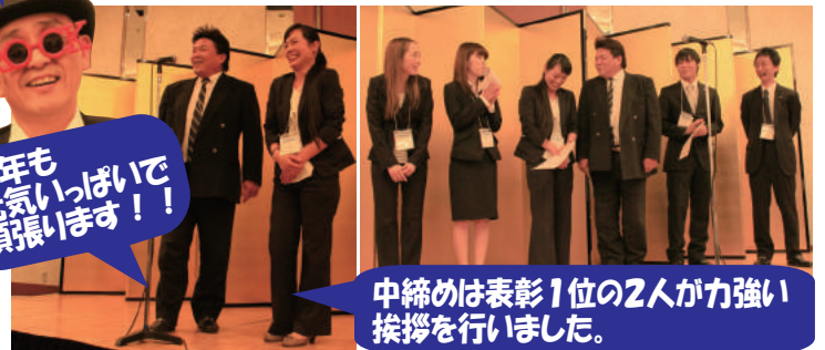
中締めは表彰1位の2人が力強い挨拶を行いました。